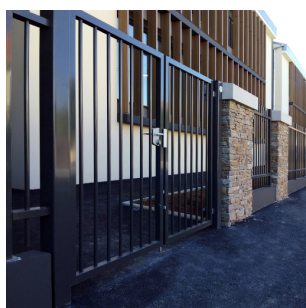
PORTAIL DOUBLE VANTAUX